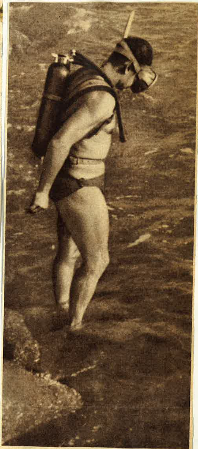
Klar zum Untertauchen! Zur modernen Ausrüstung des Sporttauchers gehören: Maske mit weitem Gesichtsfeld, Schnorchel zum Atmen an der Wasseroberfläche, Gummihandschuhe zum Balancieren unter Wasser, Unterwassermesser für alle Fälle, Harpune und Nasenklemme zum Luftausgleich gegen Ohrendruck.