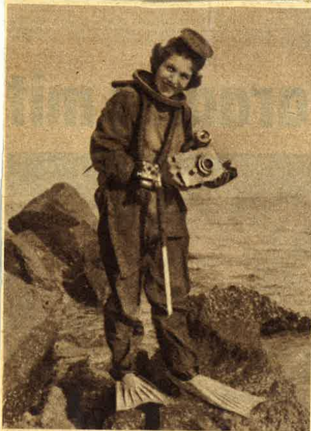
Nixe 1953. Diese junge Dame ist trotz der merkwürdigen Bekleidung bester Laune. Sie fotografiert die Welt unter Wasser und trägt hier einen Schutzanzug zum Tauchen in kalten Gewässern. Schnorchel und Tauchgerät sind miteinander verkoppelt.